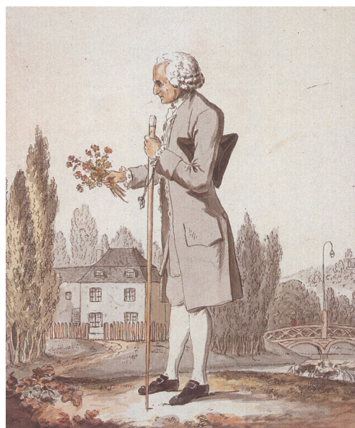
L'auteur des Confessions devant le pavillon qu'il habitait à Ermenonville.