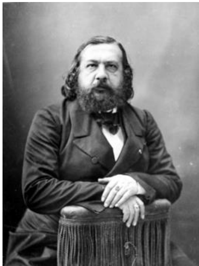
Théophile Gautier par Nadar