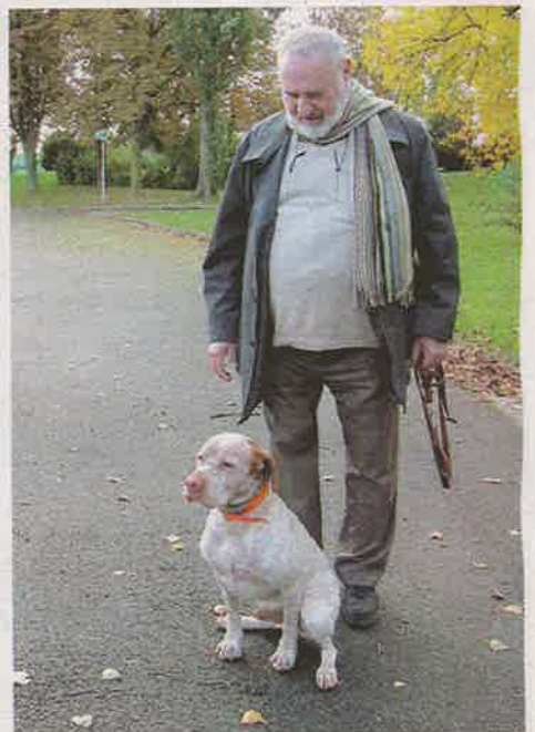
L'auteur et vétérinaire André Demontoy